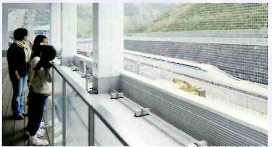
室外观展平台 亲身感受磁浮列车的行驶试验!