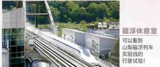
磁浮列车休息室 可以看到山梨磁浮列车实验线的行驶试验!