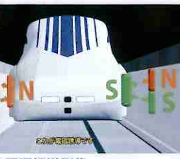
超导磁浮列车的原理 磁浮列车的原理解说影像