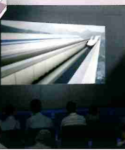
磁浮列车视听剧场 通过影像和振动实现时速500km的感觉!