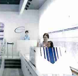
迷你磁浮列车 可以亲身感受磁浮行驶!