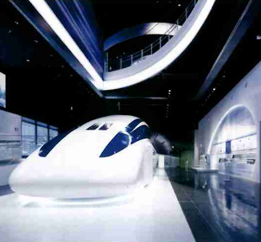
超导磁浮列车试验车辆 2003年创造铁路世界最高速度记录(当时)时速581km的实物车辆展示