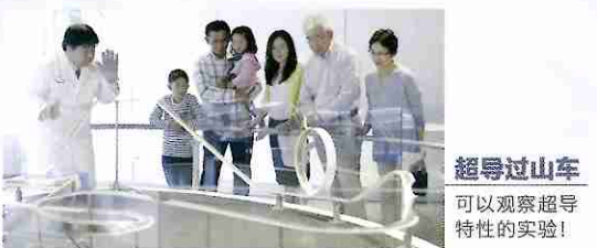
超导过山车 可以观察超导特性的实验!