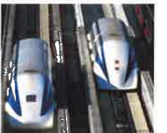
すれ違い走行試験