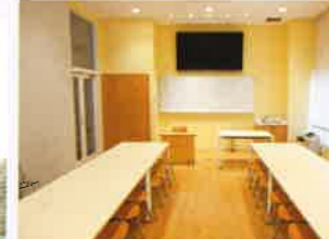
ワークショップルーム