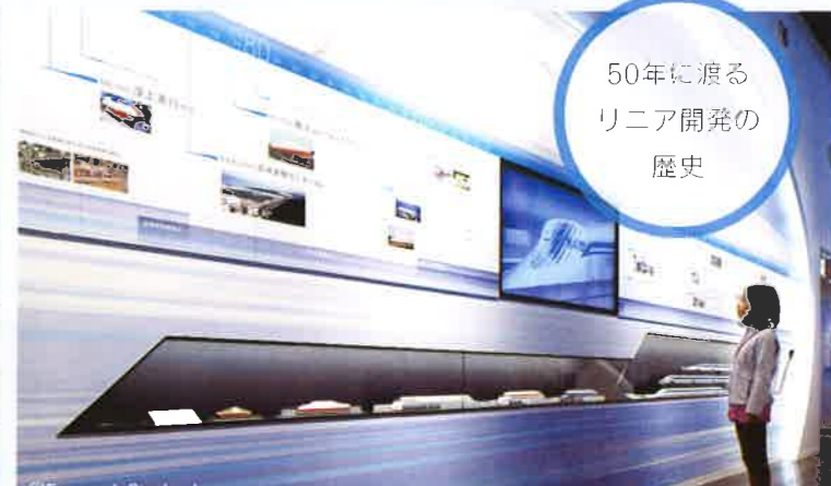
History of Superconducting Maglev